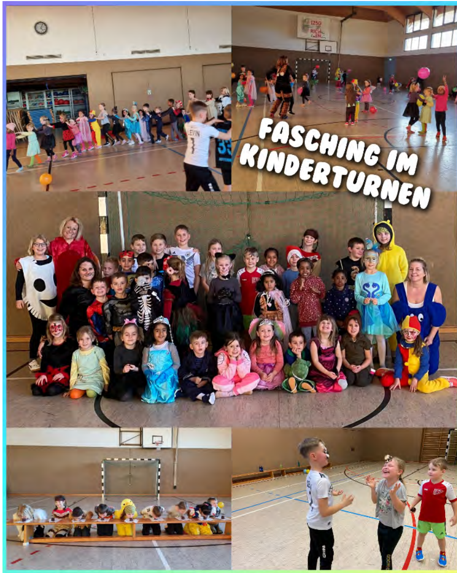
Am Montag, 13.02. war es wieder soweit: FASCHING im Kinderturnen! Mit spitzen Musik, tollen Spielen und ganz viel Spaß in den Backen war die Faschingsstunde schnell vorbei.